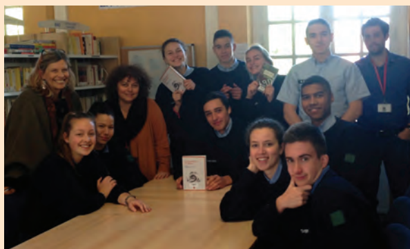
Les élèves du lycée militaire de Saint-Cyr.

Pour faire participer vos élèves, écrire à ClubTangente@yahoo.fr