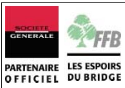
Le logo de la FFB et celui de la banque qui encourage le développement du bridge auprès des jeunes.

Il comporte un lien avec un bulletin interne trimestriel.